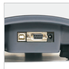
Standardowe złącza wagi