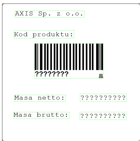
Widok gotowego projektu etykiety w programie ZebraDesigner